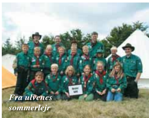
Fra ulvenes sommerlejr