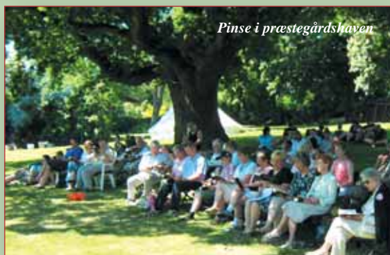
Pinse i præstegårdshaven