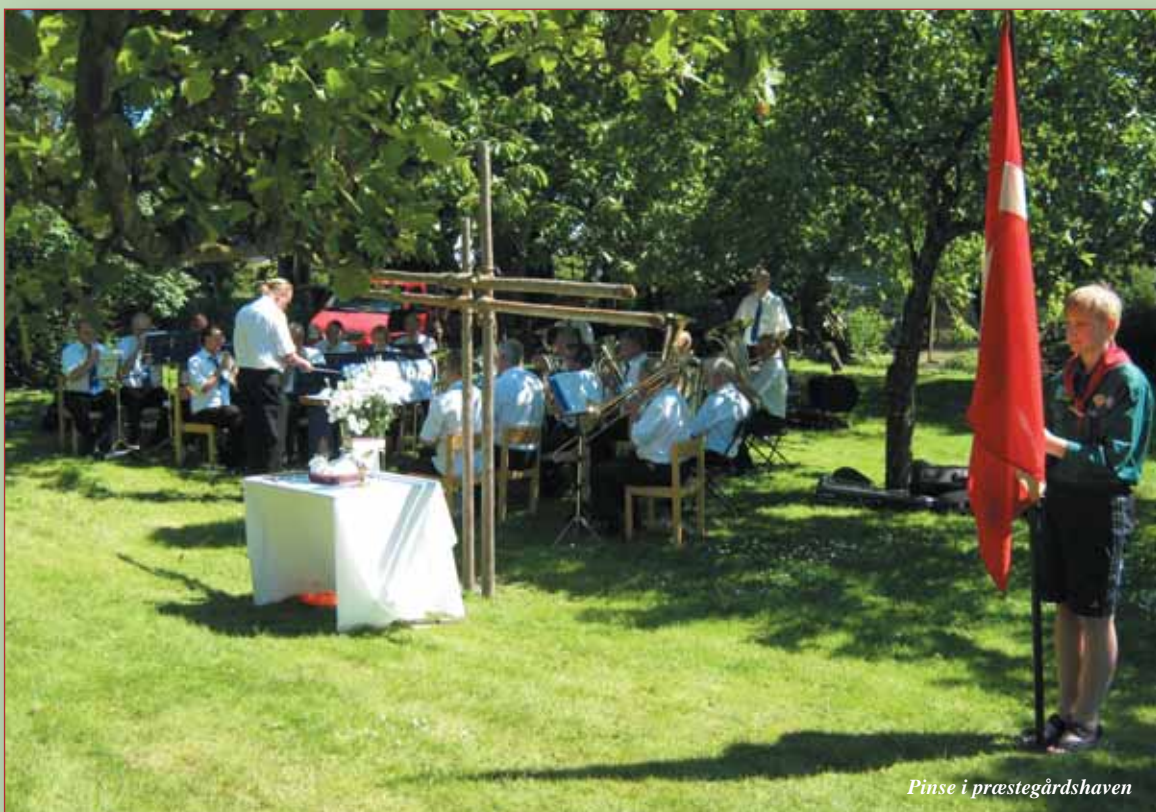
Pinse i præstegårdshaven