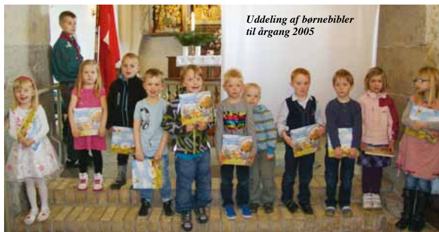
Uddeling af børnebibler til årgang 2005