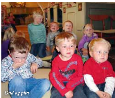
Gud og pita