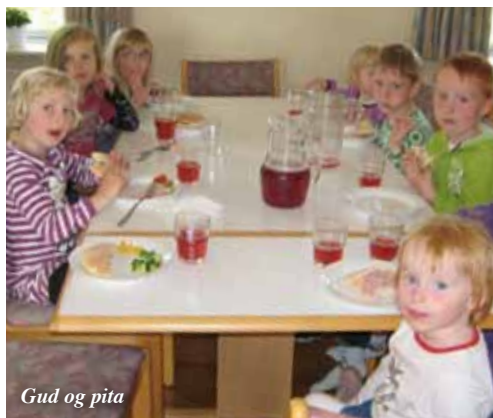
Gud og pita