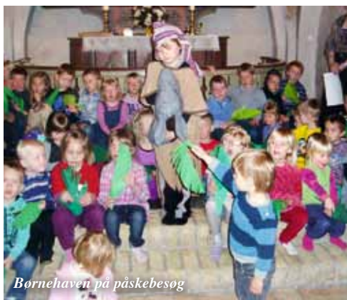
Børnehaven på påskebesøg