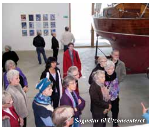
Sognetur til Utzoncenteret