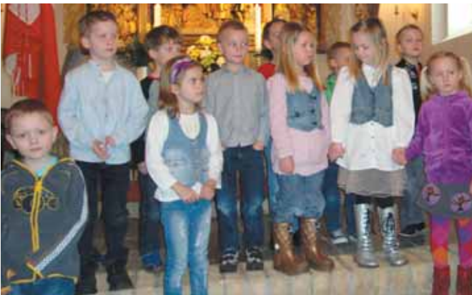
Uddeling af børnebibler Palmesøndag