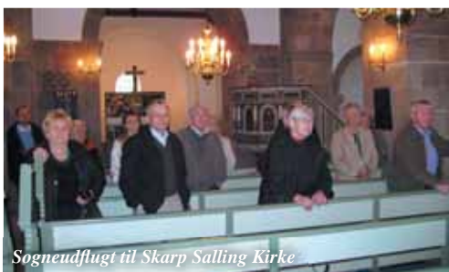
Sogneudflugt til Skarp Salling Kirke