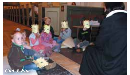
Gud & Pita