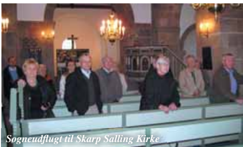
Sogneudflugt til Skarp Salling Kirke