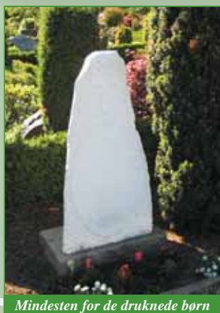
Mindesten for de druknede børn