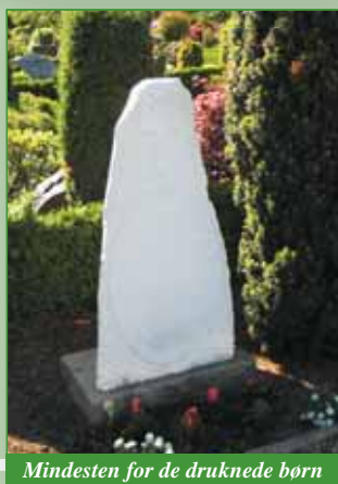
Mindesten for de druknede børn