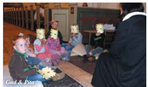
Gud & Pita