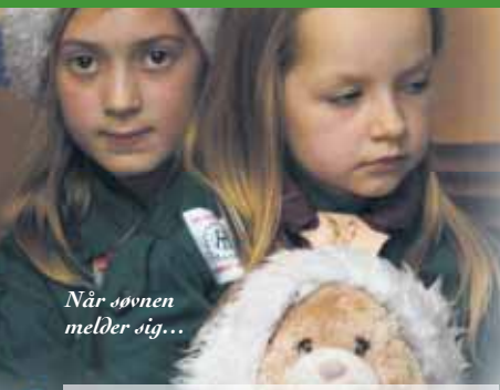
Når sønnen melder sig...